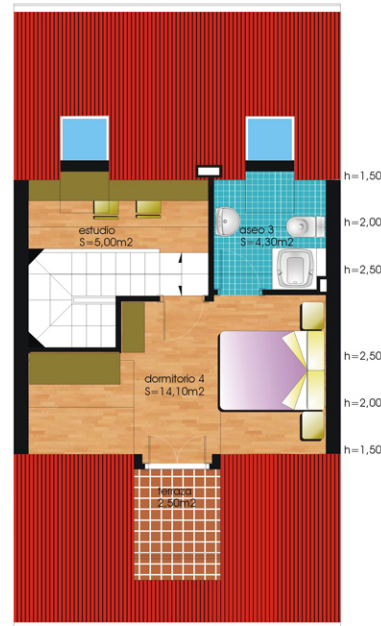
PLANTA BAJO CUBIERTA S ÚTIL = 23,40m² S TERRAZA = 2,50m²